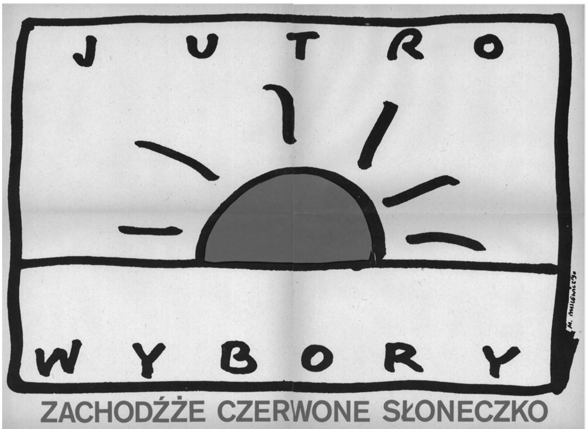
Plakat kandydatów Komitetów Obywatelskich na wybory samorządowe 1990 roku

Dla uczczenia 25. rocznicy istnienia odrodzonego samorządu miasta Tarnowa oraz pierwszych po II wojnie światowej wolnych wyborów samorządowych, które odbyły się w Polsce w dniu 27 maja 1990 roku, a dzięki którym możliwe stało się odbudowanie lokalnej samorządności, pragnąc upamiętnić wagę tych wydarzeń, ich znaczenie dla rozwoju miasta Tarnowa oraz zaangażowanie wielu osób w budowanie podwalin lokalnej samorządności, ogłasza się na terenie Gminy Miasta Tarnowa rok 2015 Rokiem XXV-lecia Odrodzonego Samorządu Miasta Tarnowa.