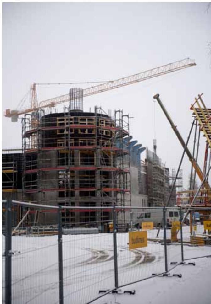
Hala Jaskółka „wyszła” już z ziemi.

Po przebudowie amfiteatr będzie przestrzenią przyjazną i otwartą dla wszystkich mieszkańców miasta. Będzie służył nie tylko do organizacji imprez i widowisk, ale również do rekreacji. Na jego terenie znajdą się też trawniki, na których będzie można rozstawić leżaki lub rozłożyć koce. Planowane są również nasadzenia drzew. Dzięki modernizacji na terenie amfite-