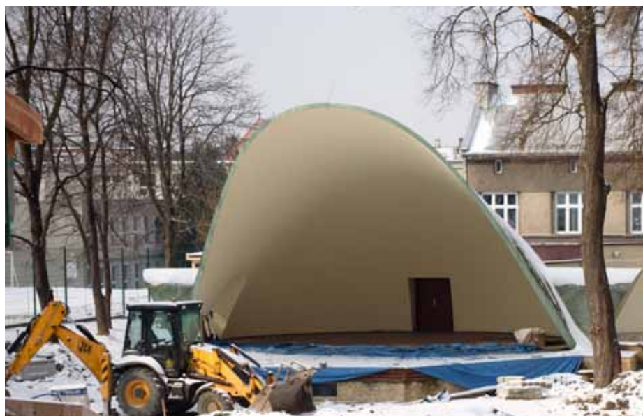
Amfiteatr ma być gotowy w kwietniu.