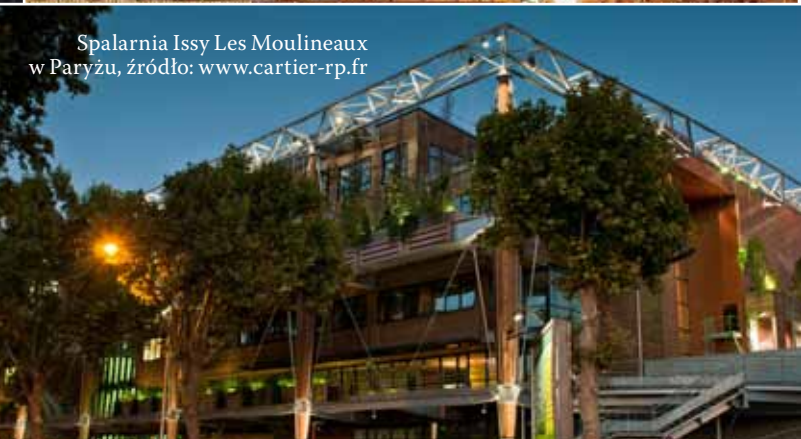
Spalarnia Issy Les Moulineaux w Paryżu