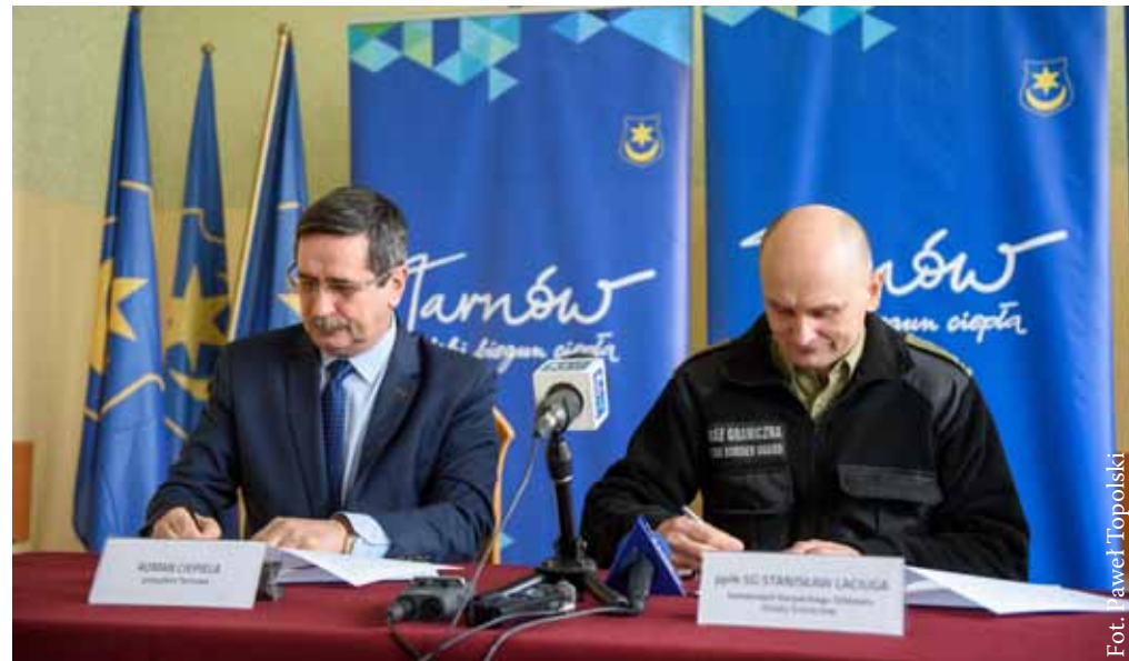
Fot. Paweł Topolski