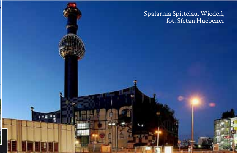
Spalarnia Spittelau, Wiedeń, fot. Sfetan Huebener