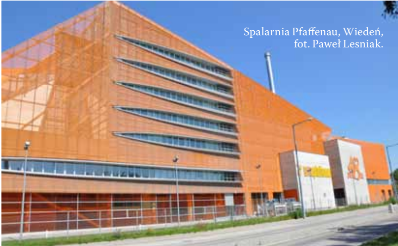
Spalarnia Pfaffenau, Wiedeń, fot. Paweł Lesniak.