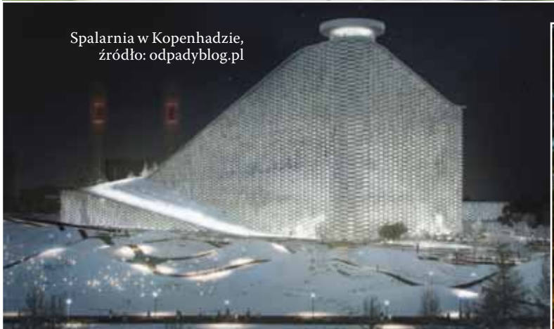
Spalarnia w Kopenhadzie