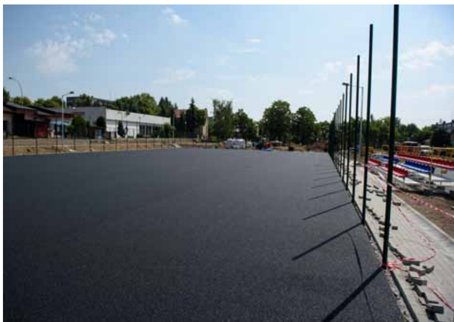
Boisko przy Gimnazjum nr 4 i Szkole Podstawowej nr 8 ma być gotowe w połowie lipca.

Powiększony zostanie również park biegowy „Marcinka”. W ramach rozbudowy obiektu, którą zgłosili mieszkańcy Tarnowa w czwartej edycji budżetu obywatelskiego, powstaną ścieżki biegowe oraz siłownia plenerowa. Celem modernizacji jest stworzenie możliwości uprawiania sportów masowych w plenerze przez cały rok. W ramach inwestycji wykonane zostanie także oświetlenie. Park