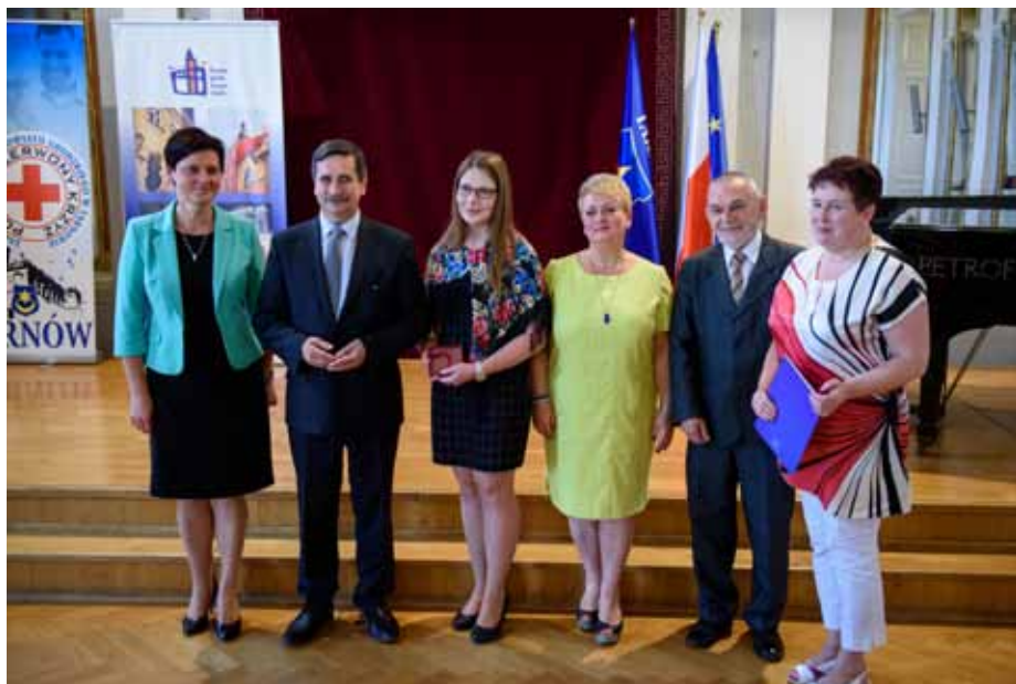
Reprezentacja PWSZ w Tarnowie podczas uroczystości, w trakcie której uhonorowano dyplomami i symbolicznymi statuetkami tarnowskich krwiodawców.

Efekty działalności tarnowskich młodzieżowych klubów honorowych dawców krwi w 2015 roku podsumowano podczas odbywającej się w Sali Lustrzanej uroczystości zorganizowanej z okazji Światowego Dnia Honorowego Dawcy Krwi. Rekordzistą w tej dziedzinie okazała się Państwowa Wyższa Szkoła Zawodowa, a spośród szkół ponadgimnazjalnych najlepiej wypadł Zespół Szkół Budowlanych. Wśród „dorosłych” prym wiódł klub PCK przy Grupie Azoty. W sumie w ubiegłym roku tarnowscy krwiodawcy oddali blisko dwa tysiące litrów krwi.