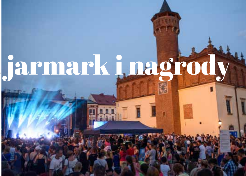
Tarnowski rynek podczas koncertu Dawida Podsiadło.