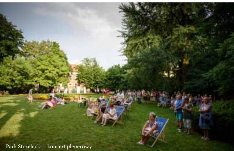
Park Strzelecki – koncert plenerowy