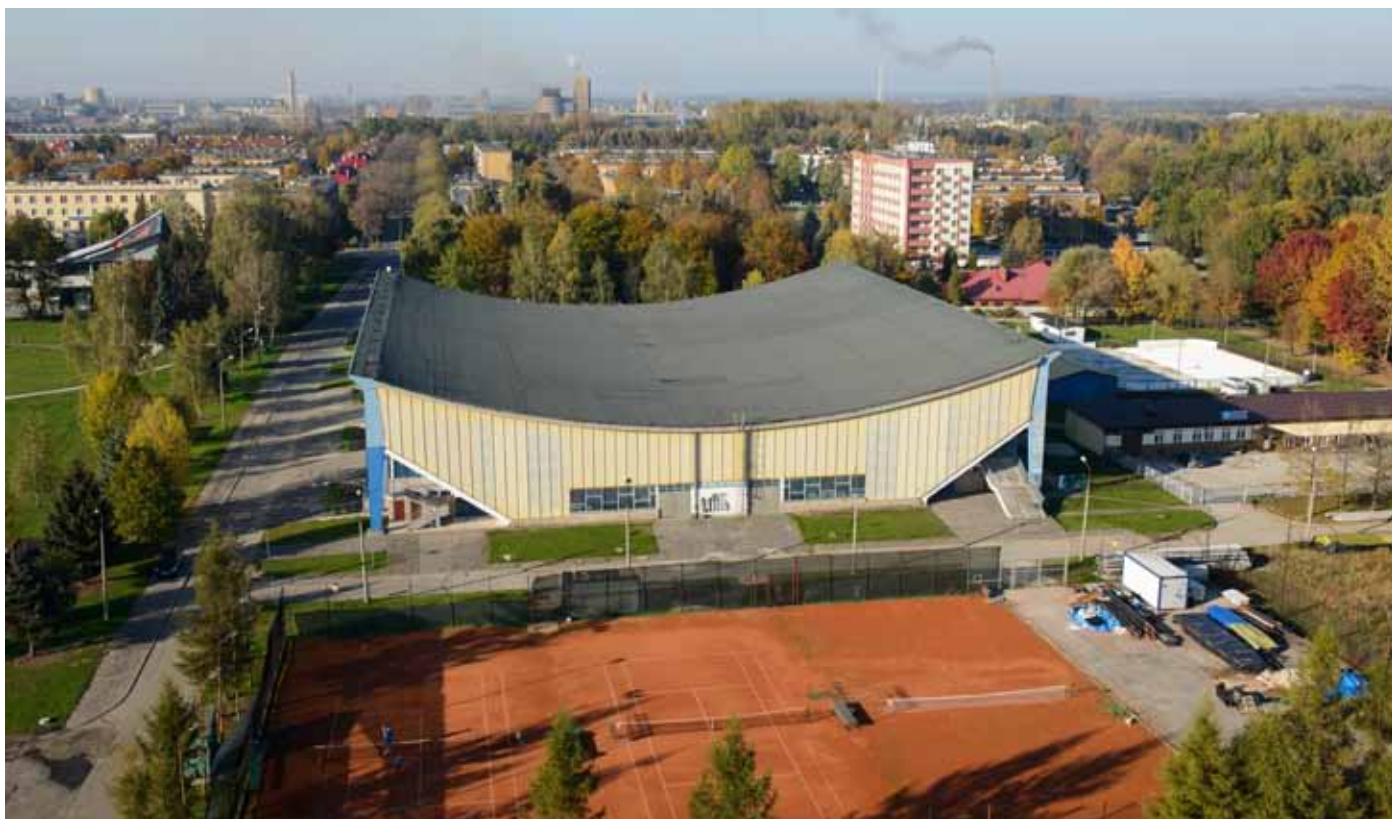
Modernizacja hali „Jaskółka” to jedna z najważniejszych inwestycji sportowych. Projekt jest gotowy.