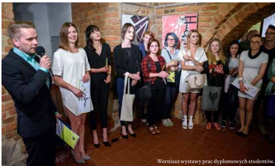
Wernisaż wystawy prac dyplomowych studentów.