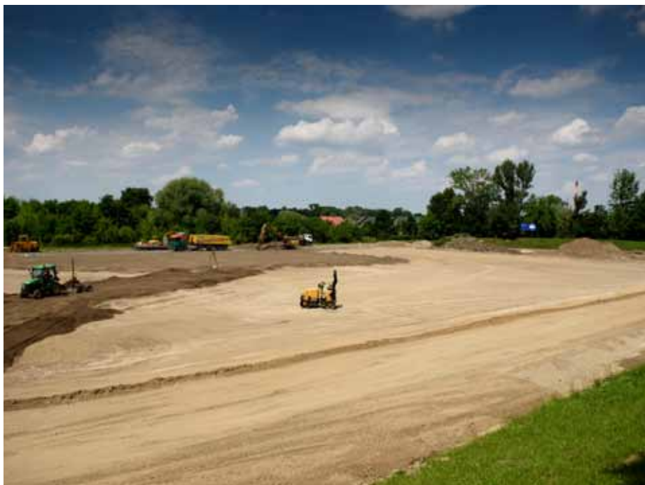
Stadion na „Błękitnych” w trakcie prac. Teren został zdrenowany. Wykonawca rozpoczął układanie nawierzchni trawiastej boiska piłkarskiego.