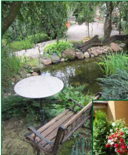
„Balkon”, 12 w kategorii „Ogród przy bloku” oraz 8 w kategorii „Ogród przy Instytucji”.

Komisja dokonała oceny odwiedzanych obiektów i wyłoniła najbardziej wyróżniające się. W tym roku jurorzy postanowili przyznać dodatkowo nagrody specjalne uczestnikom, którzy od lat biorą udział w konkursie, zajmując miejsce na podium, doceniając wkład pracy tych