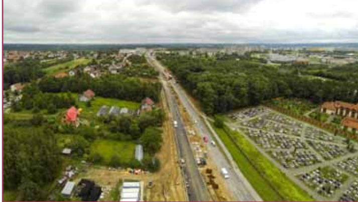
Rozbudowa ulicy Spokojnej

ok. 6 mln zł - podkreśla kierownik Biura Realizacji Inwestycji Rafał Nakielny .