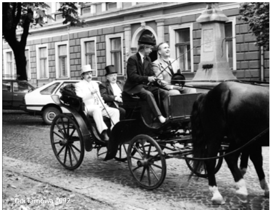
Dni Tarnowa 1992

29 lipca 1993 r. Rada Miejska w Tarnowie podjęła uchwałę w sprawie wyrażenia zgody na przejęcie przez Gminę Miasta Tarnowa zadań i kompetencji określonych przez Radę Ministrów w celu wykonania w niektórych miastach programu pilotażowego reformy samorządowej.