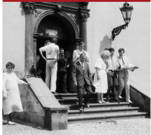
Spotkanie samorządu Tarnowa z delegacją z miasta partnerskiego Schoten w Belgii.