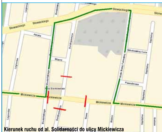
Kierunek ruchu od al. Solidarności do ulicy Mickiewicza