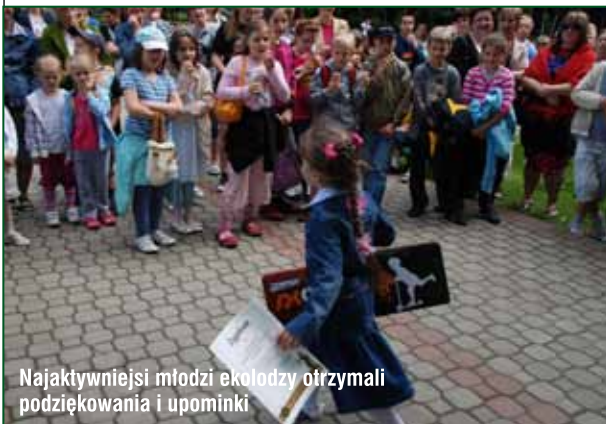
Najaktywniejsi młodzi ekolodzy otrzymali podziękowania i upominki

Laureatka jest dziennikarką od lat związaną z regionalnymi mediami. W sposób szczególnie zaangażowała się w działania związane z edukacją młodego pokolenia oraz medialną promocją działań lokalnych. Bezinteresownie wspiera przedsięwzięcia podejmowane przez placówki oświatowe; bierze udział w spotkaniach, prowadzi prelekcje, pogadanki, konkursy. W radiu RDN organizuje spotkania z dziećmi i młodzieżą, promuje ważne społecznie inicjatywy. Prowadzi wywiady mające na celu podnoszenie świadomości, wiedzy i umiejętności przyrodniczej oraz proekologicznej. Jest pomysłodawcą i realizatorem audycji radiowych upowszechniających tematykę ekologiczną, promujących działania podejmowane przez mieszkańców naszego miasta. Jest autorką magazynu radiowego „Eko-aktywni”.