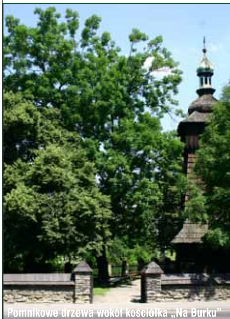
Pomnikowe drzewa wokół kościółka „Na Burku”

kiem przyrody w 1987 roku, pierwotnie pomnik składał się z 19 drzew, jednak ze względu na bardzo zły stan najstarszych drzew i zagrożenie dla zabytkowego kościoła, kilka z nich wycięto.