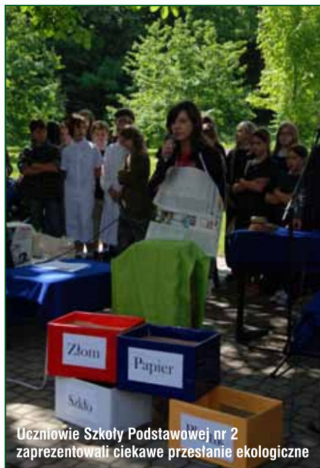
Uczniowie Szkoły Podstawowej nr 2 zaprezentowali ciekawe przesłanie ekologiczne

3 miejsce: Przedszkole Publiczne nr 8 – 680 kg.