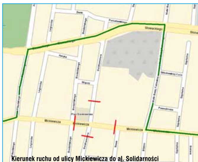
Kierunek ruchu od ulicy Mickiewicza do al. Solidarności