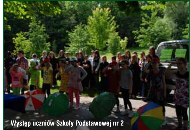
Występ uczniów Szkoły Podstawowej nr 2

Województwa Małopolskiego, Dariusz Skrzypek – ARGO-FILM, Aneta Kita – KOMETAL, Wiesław Kuldanek – MPGK oraz firmy: MPEC, Planta, Wialan, Wes-bud.